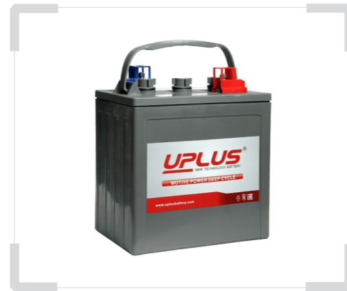
Тяговые аккумуляторные батареи UPLUS