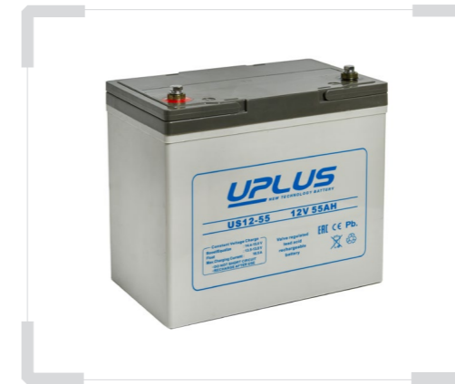
Аккумуляторные батареи для источников автономного и бесперебойного питания UPLUS