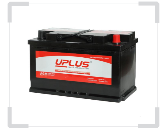
Автомобильные аккумуляторные батареи UPLUS